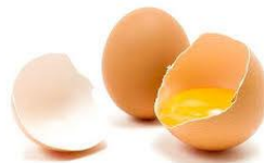
เปลือกไข่