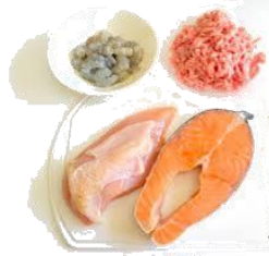
ผลิตภัณฑ์ เนื้อไก่ เนื้อปลา