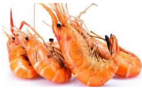
เปลือกอ่อน เปลือกไข่ กุ้ง