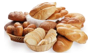
ขนมปัง ขนมหวาน เค้ก