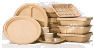
วัตถุ PLA /CPLA